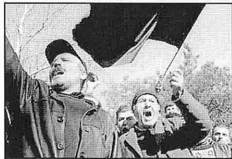
Ապաշիժէի համակիրներ կը բողոքեն Սահակաշիլիի կառախումբին շրջանէն անցնելուն ընթացքին

ՊԱԹՈՒՄ, «Ռոյթըրզ». - Հինգշաբթի, Մարտ 18ին, Վրաստանի նախագահ Միխայէլ Սահակաշիլի երեք ժամ տեւած բանակցութիւններ ունեցաւ ապստամբ Անարիա նահանգի ղեկավար Ապաշիժէի հետ, որմէ ետք երկու ղեկավարները յայտարարեցին, թէ կարելի եղած է լուծել վերջին հինգ օրերուն շրջանը զինեալ բա-